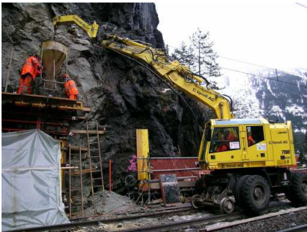
Gleisgängiger Bagger bei der Betonlieferung