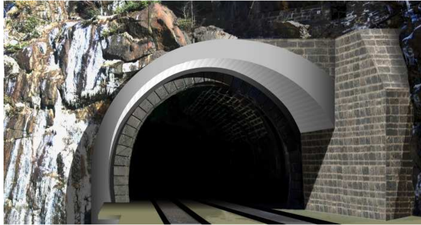
Fotomontage Portalverlängerung mit Vorsatzmauer talseitige Felsflanke