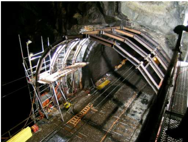
Erstellen des Lehrgerüsts bei Nacht